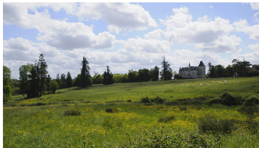
Domaine du Châtelard