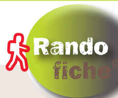
Bois du Châtelard